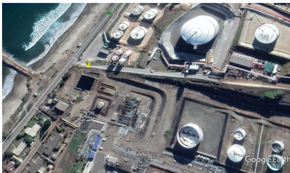
Figura 1. Ubicación de equipos de monitoreo en Terminal Quintero ENAP

Se realizó la instalación de los equipos de monitoreo atmosférico (EPAS HIM SCANNER, Environmental Devices Corporation, EEUU, figura 1) para medición en tiempo real de la concentración de Hidrocarburos Totales (HCT) en el costado norte de la laguna de decantación del sector Remodelación de ENAP Terminal Quintero (Figura 1). Adicionalmente se instaló una estación meteorológica (HOBO, Onset, EE.UU) para medición de temperatura ambiental, presión atmosférica, %HR, dirección y velocidad de viento.